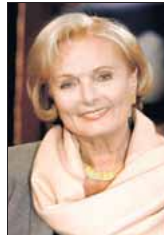
Ruth Maria Kubitschek studierte Schauspiel in Berlin und am Theaterinstitut Weimar.

Weimar. (tlz) Schon mit vier Jahren wusste die kleine Ruth Maria, dass sie Schauspielerin werden wollte. Heute ist die Kubitschek ein Star, auf der Bühne, wie im Film und im Fernsehen. Am Samstag, 10. Dezember, 16 Uhr, wird die 1931 in Komotau im heutigen Tschechien geborene Ruth Maria Kubitschek, die auch als Autorin und Malerin von sich Reden macht und unter anderem am Deutschen Theaterinstitut in Weimar studierte, im Forum Seebach erwartet. Sie wird Weihnachtsmärchen erzählen, die bei all ihren Lesungen wahre Begeisterungstürme ausgelöst haben. Wunderschöne Märchen für das Kind im Erwachsenen und für den wissenden Menschen im Kind, von Engeln und Nächstenliebe: „Wenn auf der Welt immer Weihnachten wäre“.